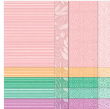
DESIGNERPAPIER 6" X 6" (15,2 X 15,2 CM) IN COLOR 2024-... 15,25 €