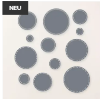
NEU STANZFORMEN NATURVERLIEBTE KREISE 43,00 €