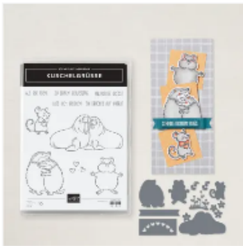
PRODUKTPAKET KUSCHELGRÜSSE (DEUTSCH)