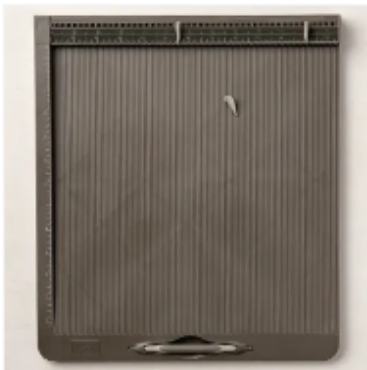
SIMPLY SCORED FALZBRETT